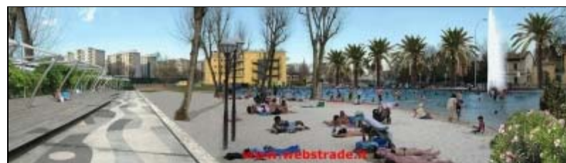
Il Naviglio a Corsico

di Giuseppe Di Giampietro arch, Webstrade.it